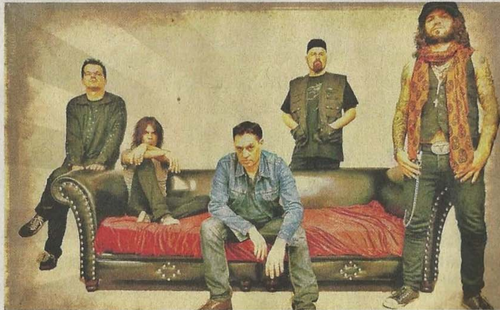
„The Counts Of Morania“ rocken im Schilderhaus.